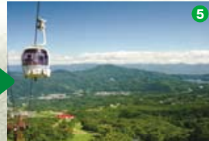
スカイケーブル山頂駅