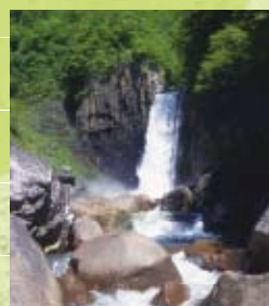
日本の滝百選・苗名滝