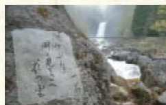
苗名滝と一茶句碑