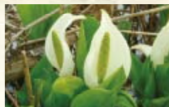
いもり池のミスバショウ

燕温泉から赤倉温泉、新赤倉温泉、妙高山を湖面に映し出すいもり池を経て苗名滝までのコース。妙高山麓に広がる温泉郷を通り、白樺林や田園風景などを楽しみながら妙高高原をたっぷり感じる変化に富んだ健脚向けロングコース。