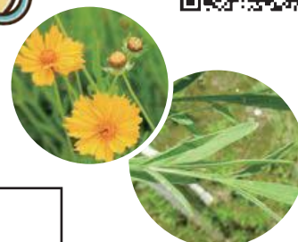
▲オオキンケイギクの花と葉