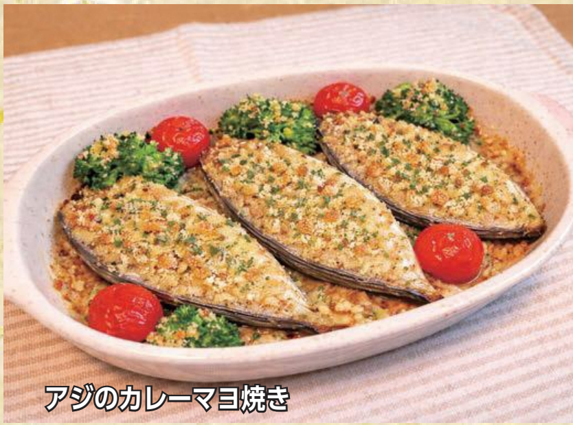
アジのカレーマヨ焼き

5月は端午の節句にちなんだ行事食として、ちまきや柏餅などを味わい、子どもの健やかな成長を願う季節です。