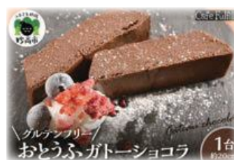
▲ Café Fulfill