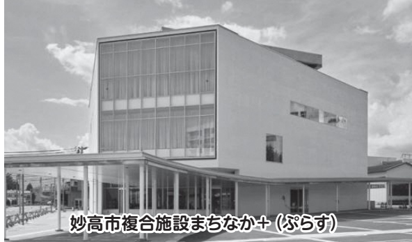
妙高市複合施設まちなか+ (ぶらす)

課長 複合施設の管理運営に必要な紙類のほか、各種イベント事業に必要な消耗品を計上している。図書は備品購入費として扱い、週刊誌や月刊誌などの雑誌類は消耗品として購入するものであり、50タイトル程度を予定している。