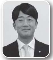
島田 竜史 議員