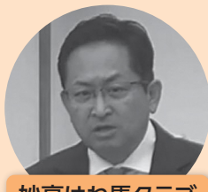
妙高はね馬クラブ