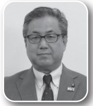
渡部 道宏 議員