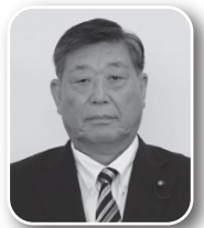
阿部 幸夫 議員

市長 イベント情報はホームページのカレンダーに集約し、開催時期や会場、内容を一覧できるようにしている。毎週金曜日には、LINE、インスタグラム、フェイスブックといったSNSを活用して週末イベント、お出かけ情報を発信している。今年度策定した妙高市戦略的広報基本方針に基づきイベント対象者に応じて媒体を選定し、デザインや表現方法を含めた見直しを行い、発信していく。