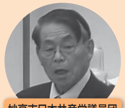
妙高市日本共産党議員団

市長 避難所環境の改善を図るために整備する備蓄品は、熱中症対策や寒さ対策のためのスポットクーラーやヒーターのほか、停電時に活用する投光器や蓄電池、プライバシー保護のための間仕切りテンの購入を予定している。こ