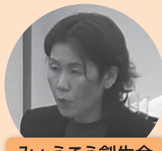
みょうこう創生会