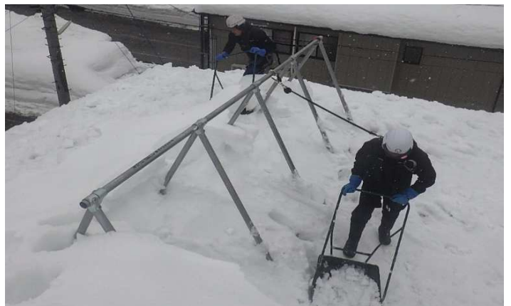
命綱固定アンカー使用例