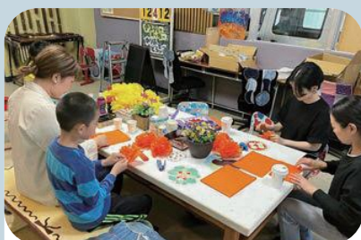
あらい七夕まつりへの協力

月・金曜を活動日として高校生が主体となり自分たちのやりたいことを実現するために集合。さまざまな活動を行っています。