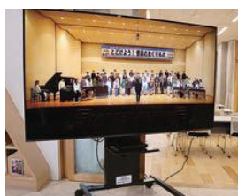
◀大型テレビとDVDプレーヤー