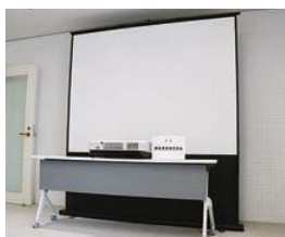
超短焦点プロジェクターと自立式スクリーン▶

市複合施設「まちなか+」に、妙高ライオンズクラブから大型テレビとDVDプレーヤー、新東産業(株)から超短焦点プロジェクターと自立式スクリーンを寄贈いただきました。