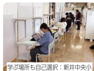
学ぶ場所も自己選択：新井中央小