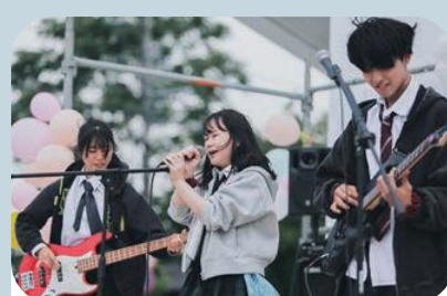
ステージイベント「よりふえす」実施

あらい七夕まつりの飾りの制作を高校生と市民がいっしょになって実施。みんなの思いがひとつになり、まちを華やかに彩りました。