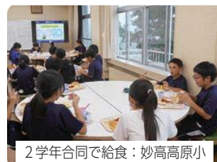
2学年合同で給食：妙高高原小