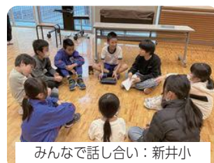
みんなで話し合い：新井小