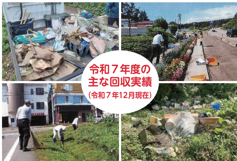
令和7年度の 主な回収実績 (令和7年12月現在)