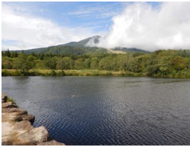
スイレン駆除後のいもり池