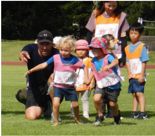
ちびっ子レース よーいドン！