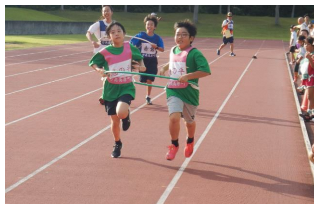
最後は、地区対抗フラフープリレー