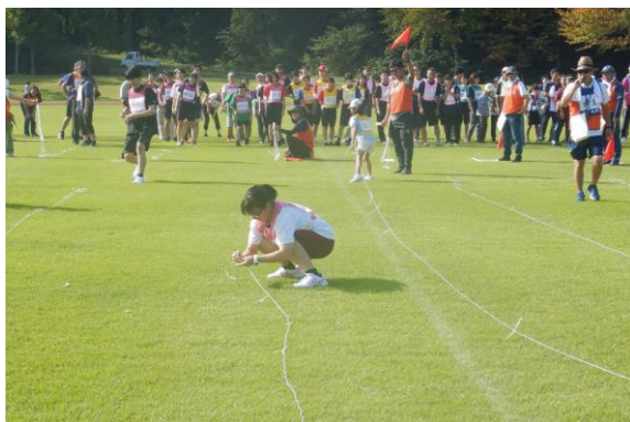
なかなか伸びない 紐つなぎレース 隣はゴール？