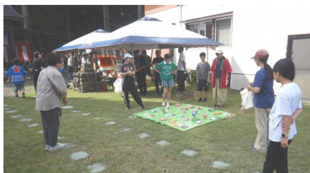
子供も大人も夢中 型抜き、輪投げ