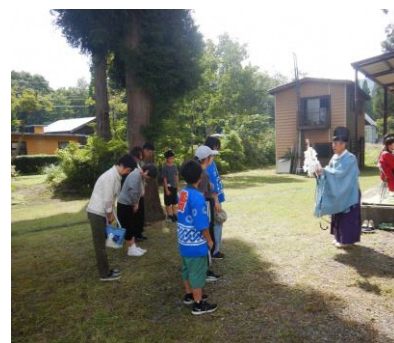
厳かに行われた神事