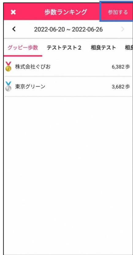
新潟県企業対抗歩数ランキング画面