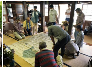
基本講座B 鮫ヶ尾城跡 ～古地図で学ぶ～