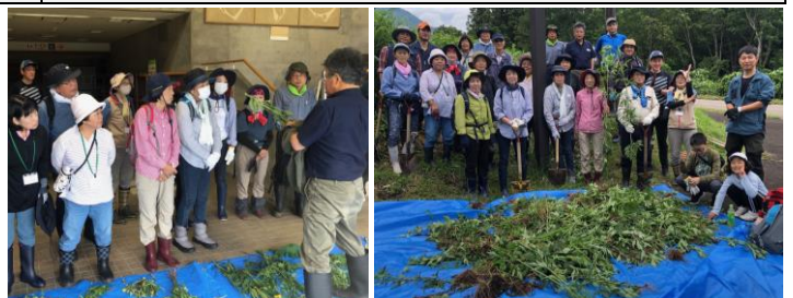
特定外来種の説明を聞き、実際に駆除してみました。