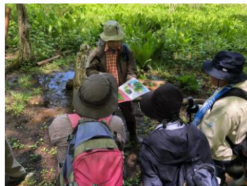
基本講座A 夢見平散策 ～植物の説明を聞く～

（注）MA（妙高アドベンチャー）とは、冒険を活動の柱として個人の成長と人間関係づくりを支援する学習プログラム