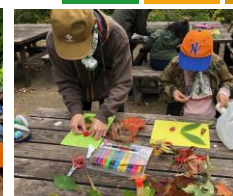
葉っぱアートの制作と作品