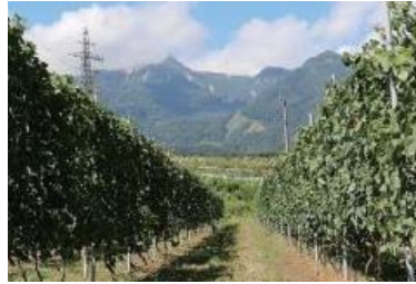
坂口げんき農場のブドウ畑

第一号石蔵の画像引用 https://www.iwanohara.sgn.ne.jp/index.html