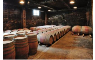
岩の原葡萄園の第一号石蔵