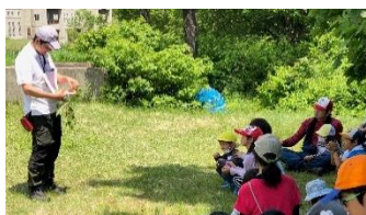
春の草花遊びの説明