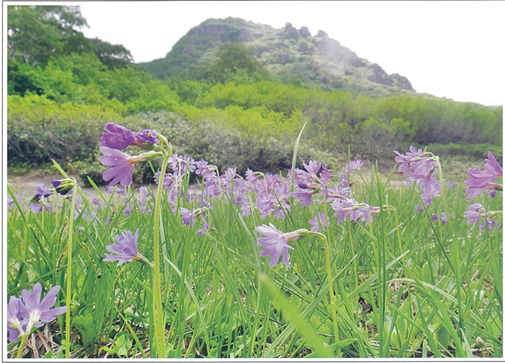
「妙高山大正池近くの白山小桜」保護司 坂田 斉 撮影