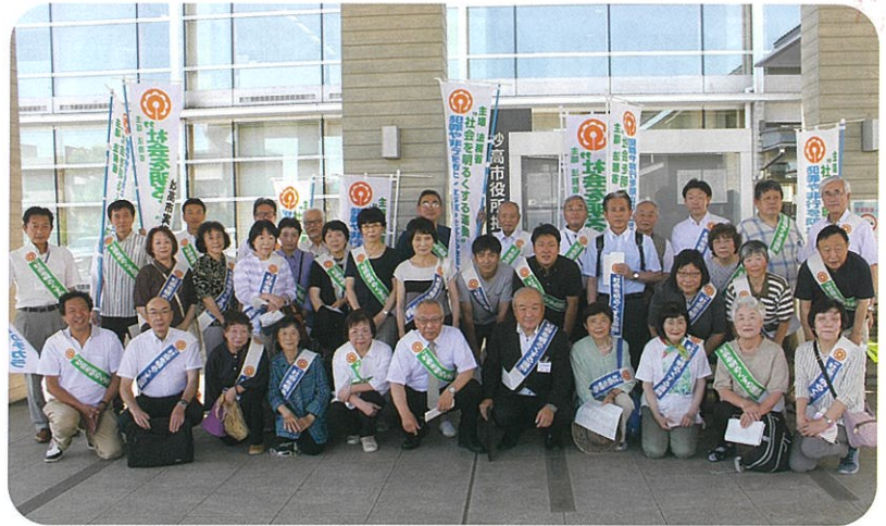
7/6 (木) 保護司会と市内15団体の皆様による キャンペーン活動が行われました。