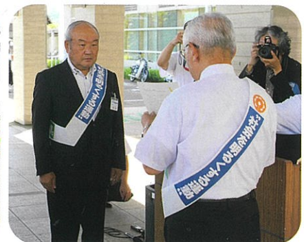
内閣総理大臣メッセージ伝達