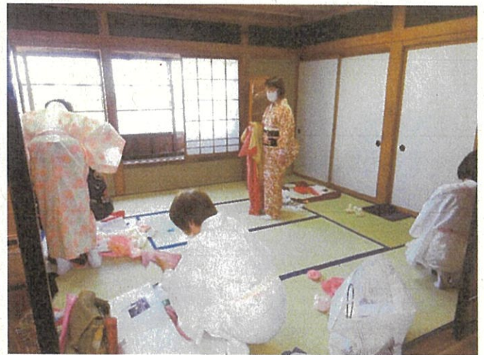
着付け教室 (6月～7月 3回)