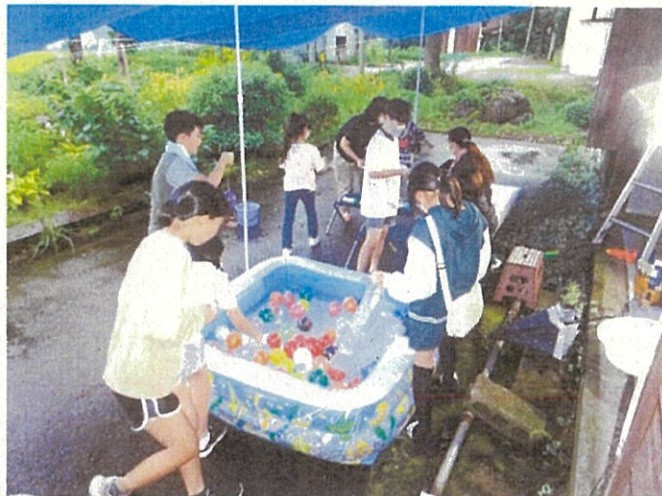
附属小6年親子夏休みお楽しみ会 (9月3日)