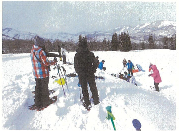
附属小6年生親子メープル採取体験（2月26日）