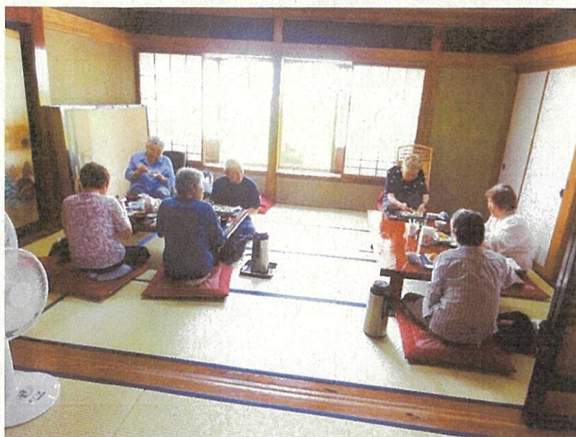
通年じよんのびサロン (2組のグループが一緒に利用)