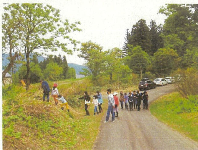
附属小6年山菜採りと山菜天ぷら体験 (5月15日)