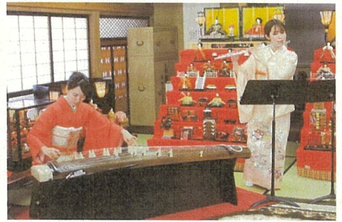
雛祭り箏&フルートコンサート開催（3月6日）