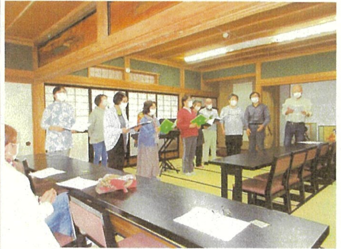
カフェオープン2周年記念「うたごえカフェ in 矢代」開催 (11月26日)