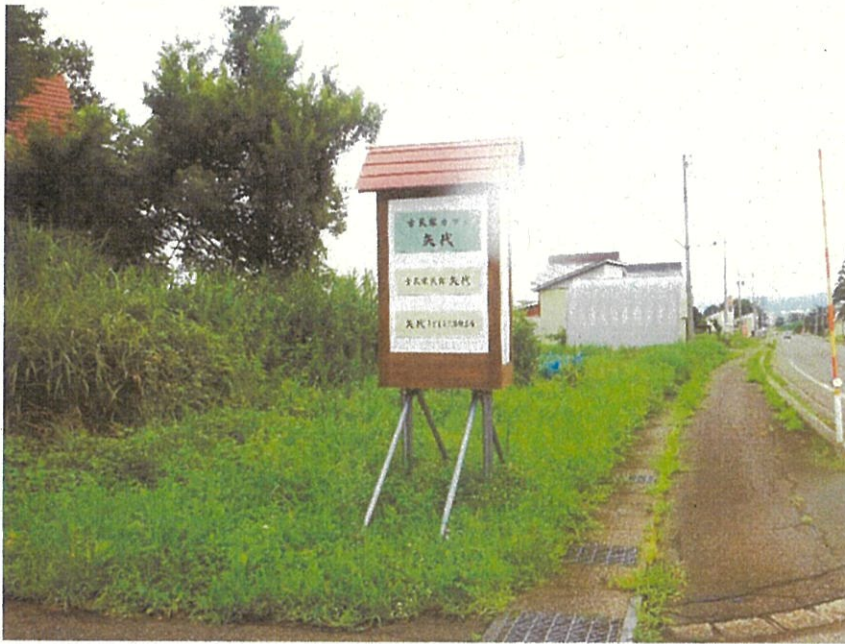
案内看板新設 5月 (附属小5年生が、矢代で栽培した米を販売した収益を頂いた)