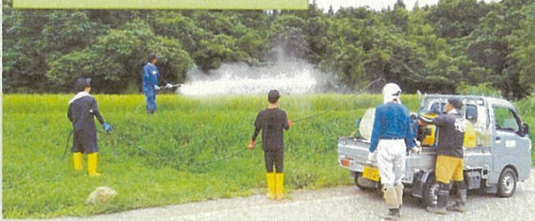
カメムシ防除作業中 農) やしろ