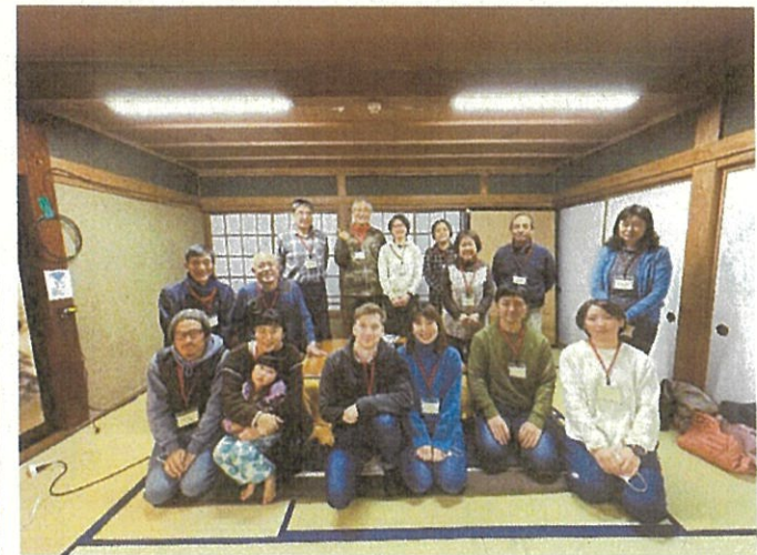
妙高市移住定住お試しツアー (2月11日)