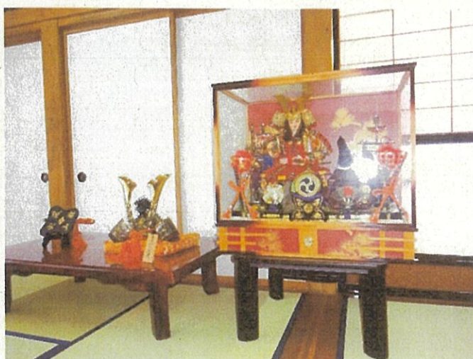
5月人形展 (4月21日~5月30日)