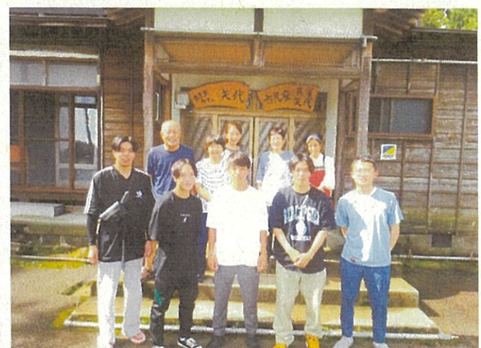
東京農大ワーキングホリデー宿泊受け入れ (8月22日～30日)