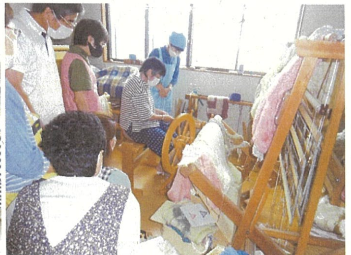
スタッフ研修：津南町農家民宿サンベリー (7月19日)