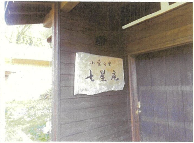
スタッフ研修：飯山市一棟貸古民家民宿「七星庵」見学12月6日)