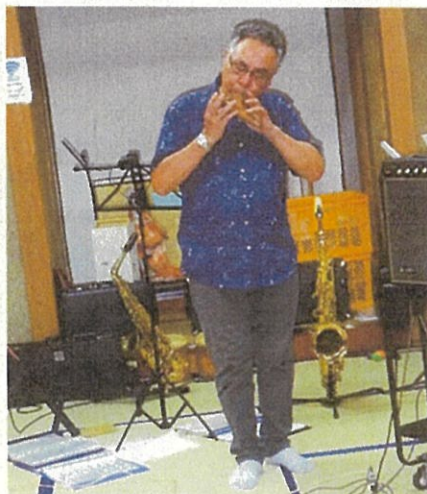
ザイダンバンド&オカリナコンサート開催 (9月4日)