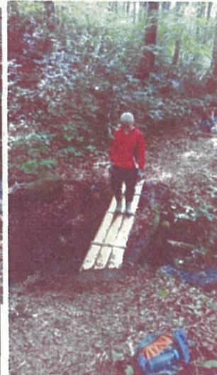
8月11日(木)遊歩道の整備 人が渡っても、安定することを確認