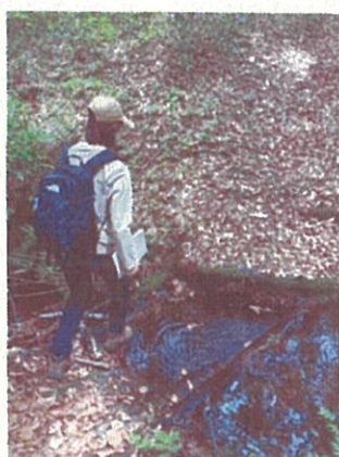
6月18日(土)の实地調査 橋が傾き、土砂が溜まって、橋の上を水が流れている。