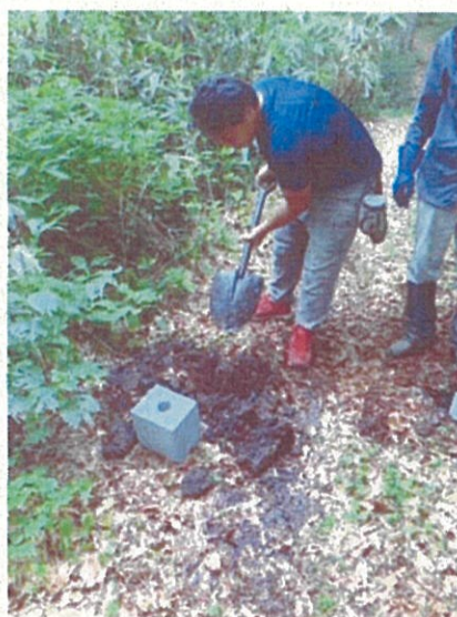
8月3日(水)遊歩道の整備 車止めの設置。 わだちの跡からバイクが侵入していることが推測されていた。