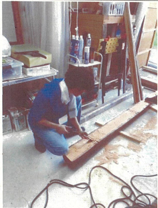
橋木材の加工(8月4日(木))