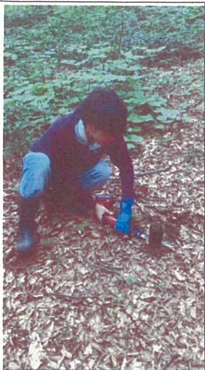
8月3日(水)遊歩道の整備 道に出ている杭の頭を切断