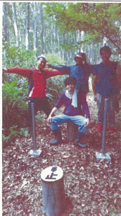
8月3日(水)遊歩道の整備 設置した車止めの所で記念撮影