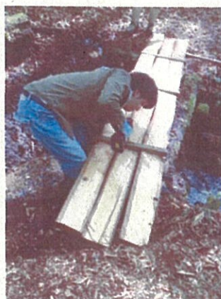
8月11日(木)遊歩道の整備 木橋の設置作業