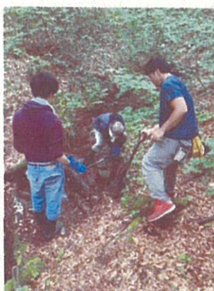
8月3日(水)遊歩道の整備 橋の周りで流れを止め、土砂を浚渫