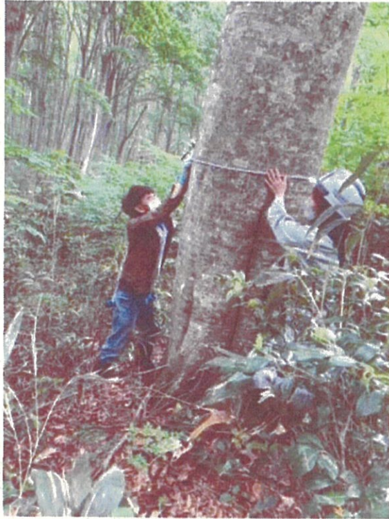
6月18日(土) 現地調査 太いブナだと外周 200 cm以上あることが判明。