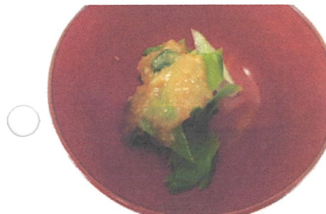
甘草 (カンゾウ) の酢味噌和え