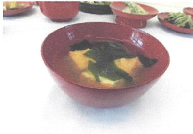
味噌汁 (わかめと厚揚げ)