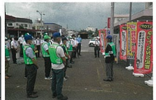
十日町駅前における特殊詐欺被害防止広報