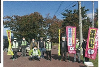
阿賀野市岡山町における防犯広報