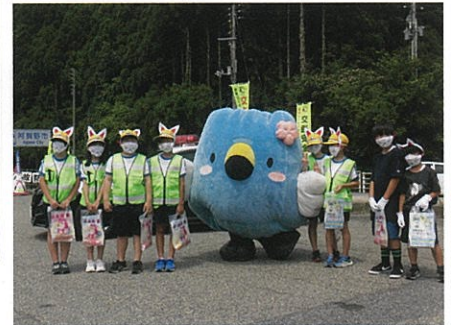
阿賀町峠山パーキングにおける防犯広報