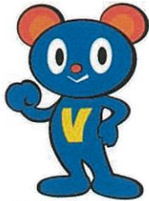
少年サポートくん