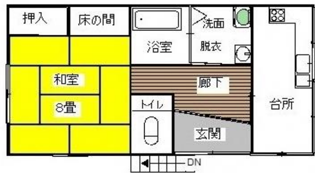
2階 間取り図 (現況を優先します。)