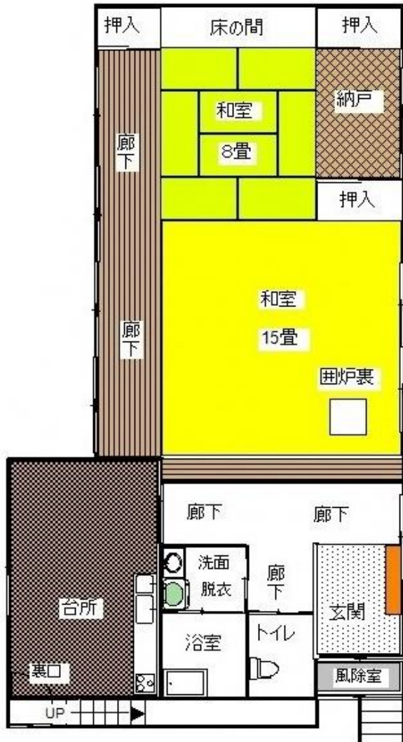
1階 間取り図 (現況を優先します。)