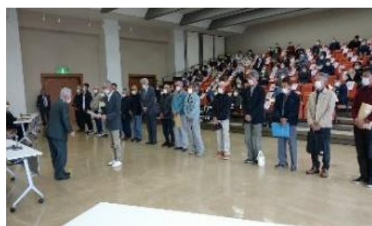
不法投棄監視員任命式