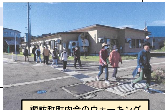
諏訪町町内会のウォーキング