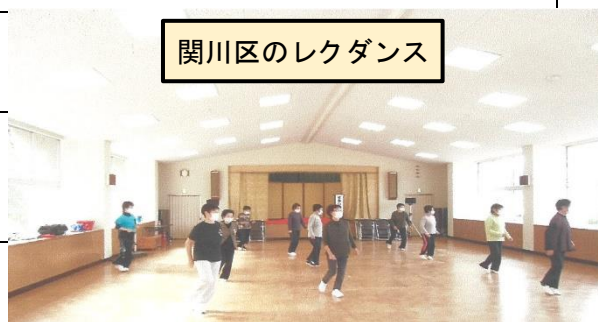
関川区のレクダンス