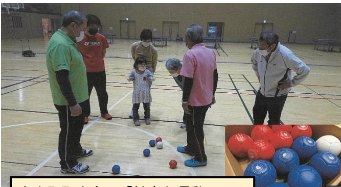
白山町町内会の「健康と運動の日」 (※写真：ポッチャ)

※1メニューに対して、協議会内で複数会場や組織で実施している場合は全てが交付対象となります。