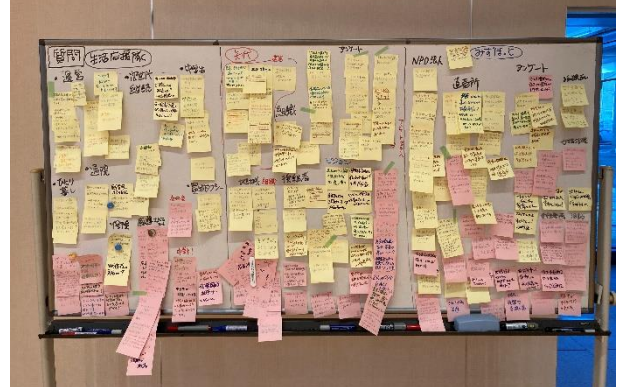
ホワイトボードいっぱいの質問や感想が集まりました

地域のニーズを把握したい、新たな活動を始めたいといった地域を支援できるよう、各種補助制度を用意していますので、お気軽に市役所地域共生課へお問い合わせください。