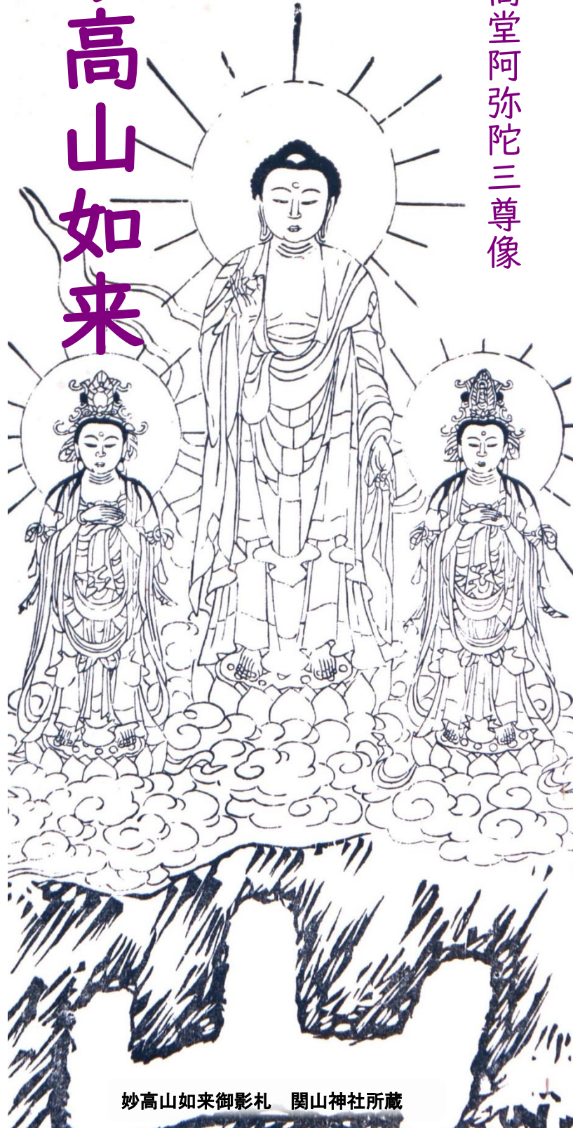
妙高山如来御影札 関山神社所蔵