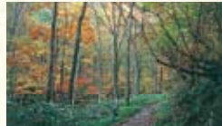
紅葉のブナ林の遊歩道

●乙見湖(笹ヶ峰ダム)から神道山の裾を巡るコースで残雪やミスバショウ、ブナ林、四季の花々など楽しみも豊富なコースで沿道には手作りの稲荷神社や神彦・道姫と名付けられているミスナラの巨木や幹回り10mの地蔵カツラ、ハルニレなど自然が生んだ巨樹・巨木が多数見られます。5月中～下旬の残雪期には、夢見平湿原で巨大なミスバショウの群生を見ることができます。また、コース途中では、トロッコ敷、製材所、炭窯などの跡が残されており、山中での昔の暮らしを垣間見ることができます。