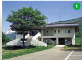
笹ヶ峰グリーンハウス

●標高1,300メートルに位置する笹ヶ峰高原では、初夏、残雪の山々を背景に広大な笹ヶ峰牧場や、黄色いキンボウゲの花の絨毯が広がります。また、笹ヶ峰牧場にはゆっくりと草を食む牛や、ロックフィルダムの乙見湖、平成の名水百選に選ばれた「宇棚の清水」やその清らかな水が流れ込む清水ヶ池、ドイツトウヒの林など雄大な大自然のロケーションをお楽しみいただけます。