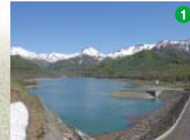
乙見湖(笹ヶ峰ダム)

●笹ヶ峰高原の神道山の裾野をめぐる夢見平遊歩道は、高山植物やブナ林、夢見平湿原のミスバショウの群落、秋の紅葉が美しい。また、遊歩道は大変歩きやすく整備され、約4キロのコースと約10キロのコースがあり、大自然を存分に楽しめます。