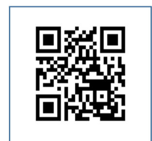
16・17歳ワクチン接種 予約システム QRコード

右記にあるQRコードを読み取っていただき、ワクチン接種予約システムから「ワクチン接種を希望しない」を選択してください。手続きには、接種券番号の入力が必要となりますので、お手元に接種券をご用意して手続きを行ってください。