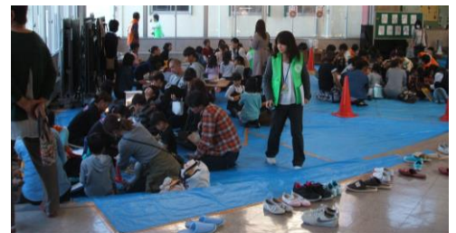
新井中央小学校コミュニティフェスティバルの様子 毎年、大勢の来場者で賑わいます

文化祭では、地域のみなさんによる作品の出展や、芸能の披露が行われます。たくさんのみなさんに見ていただくことが励みにもなりますので、ぜひご覧ください。