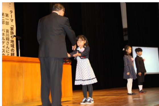
昨年のつどいでの受賞の様子