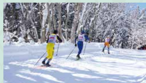
全日本スキー連盟公認クロスカントリースキーコース