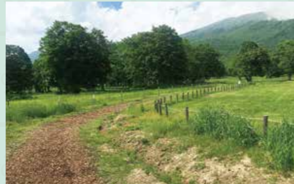
ウッドチップの敷かれたコース

●HPアドレス… http://www.suginosawa.com/gasyuku/