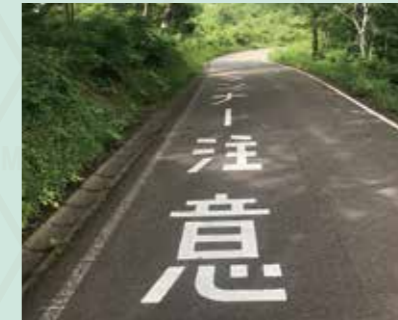
ランナーに配慮したロードマーカー