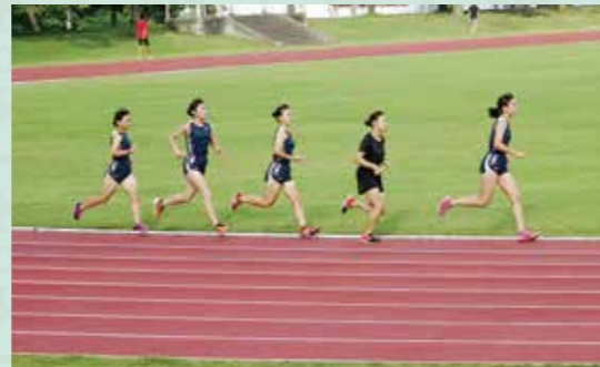
スーパーX 8レーンのトラック