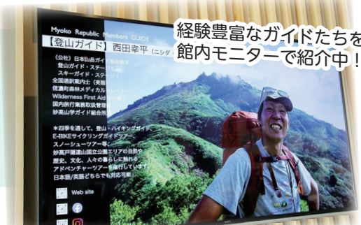
経験豊富なガイドたちを館内モニターで紹介中！

身近な自然でも、ガイドと一緒に冒険すると様々な魅力を新たに発見・体験することができます。そして知るほどに、次の冒険と発見が楽しみになるはず。皆さんが安心して妙高の自然を体験できるよう経験豊富なガイドを紹介しています。気軽にご相談ください。