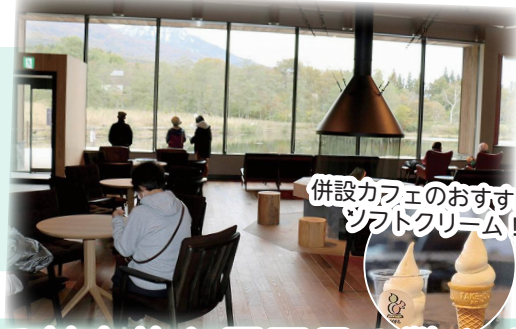
併設カフェのおすすめはソフトクリーム！

いもり池のすぐ横にあるため、天候、季節、時間帯などによって様々な表情の妙高山・いもり池を楽しむことができます。いもり池周辺を散策後、併設カフェでお茶しながら、妙高自慢の眺望をゆっくり楽しんでみませんか？